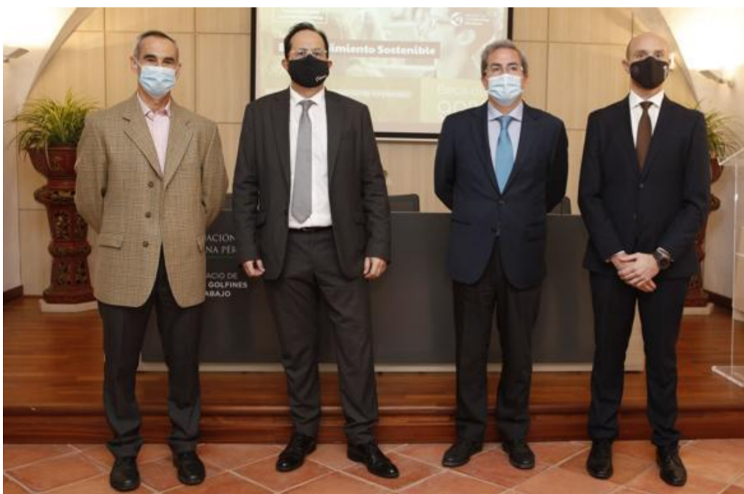
Presentación en el Palacio de los Golfines de Cáceres