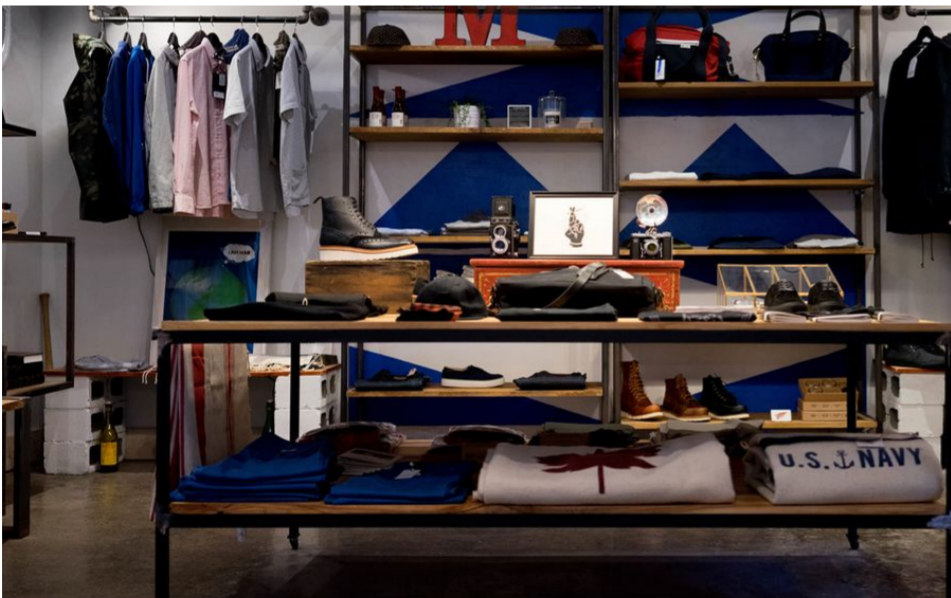
Apuesta por su calidad. #RegalaNegocioLocal

Todo esfuerzo tiene su recompensa y el de estos fantásticos alumn@s se ha materializado en forma de diploma con el que se certifica que han superado con éxito la Formación Troncal enmarcada en el programa PICE